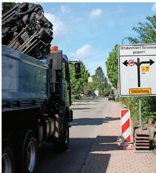
Die Umleitungen sind seit Montag ausgeschildert: Lastwagen werden über Haber-schlacht geschickt.

Kieser erinnerte auch daran, dass eine Ortsumfahrung für Brackenheim bereits im vordringlichen Bedarf des Generalverkehrsplanes gestanden habe. Die Stadt verzichtete zugunsten von Dürrenzimmern darauf. Der vom Verkehr schwer belastete Stadtteil wurde mit einer eigenen Umfahrung vom Land dennoch nicht mehr berücksichtigt. Das wurmt die Anwohner.